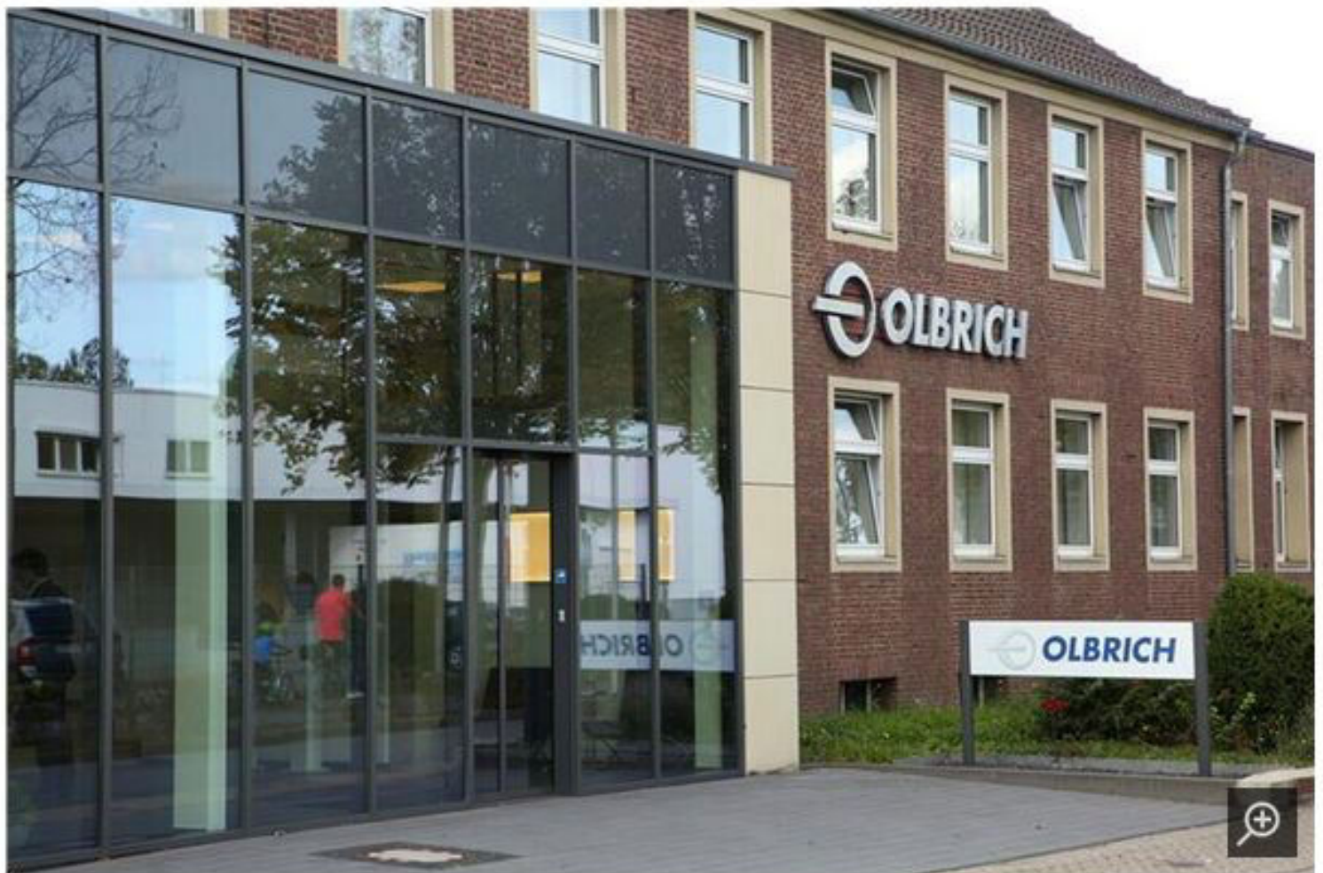
Der Hauptsitz der Firma Olbrich an der Teutonenstraße