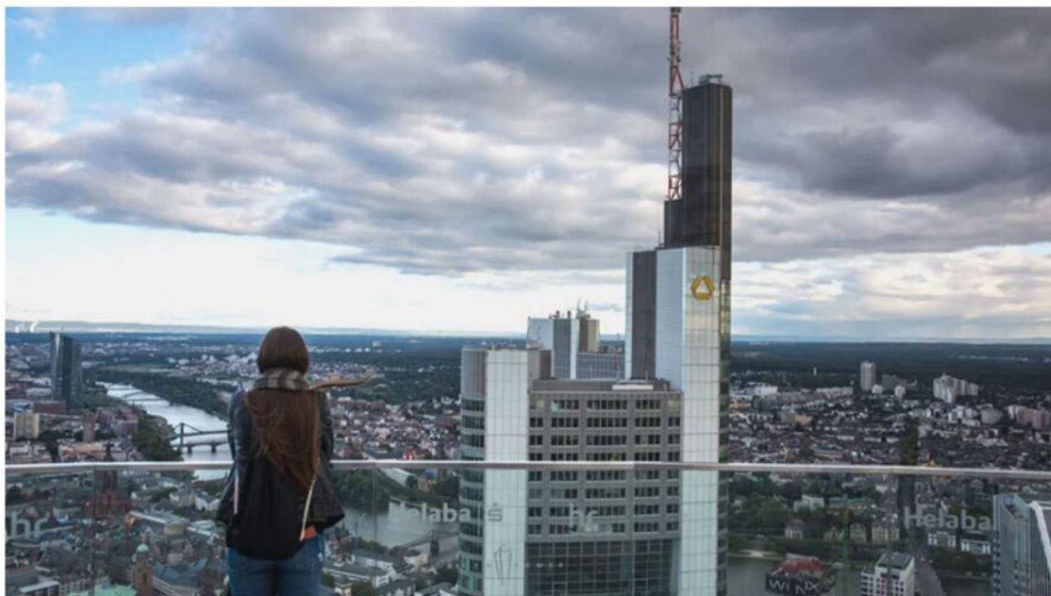
Blick auf das Commerzbank-Gebäude in Frankfurt am Main

20. September 2019, 15:48 Uhr / Quelle: ZEIT ONLINE, dpa, Reuters, sig / 73 Kommentare