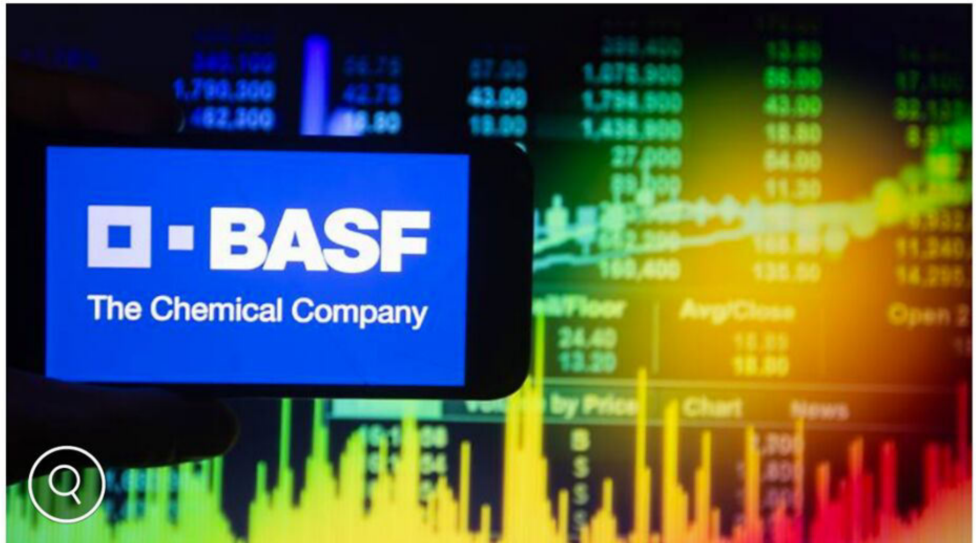
BASF baut weltweit Tausende Stellen ab.