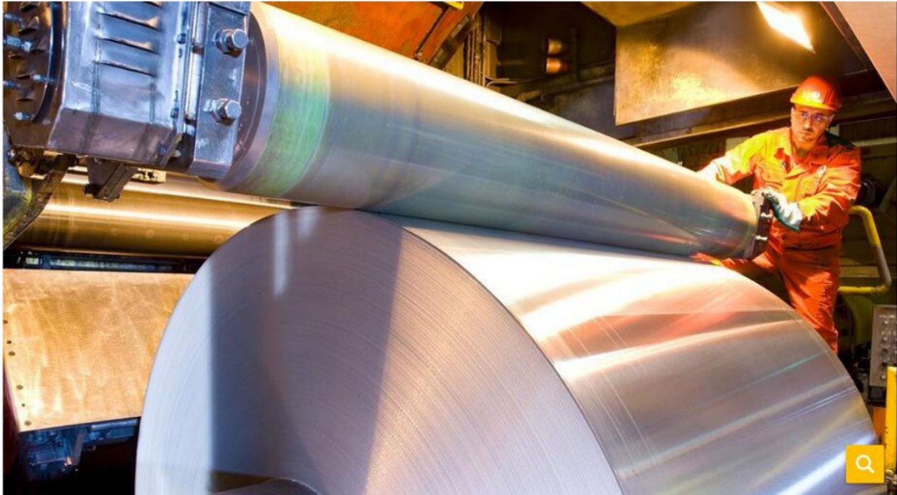
Hydro Aluminium Rolled Products in Grevenbroich.

11. September 2019 um 21:00 Uhr | Lesedauer: 3 Minuten