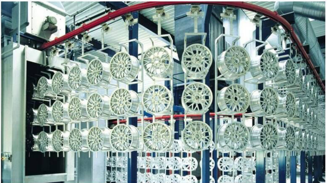
Felgenlackieranlage von Eisenmann

Der Zulieferer musste Ende Juli Insolvenz anmelden.