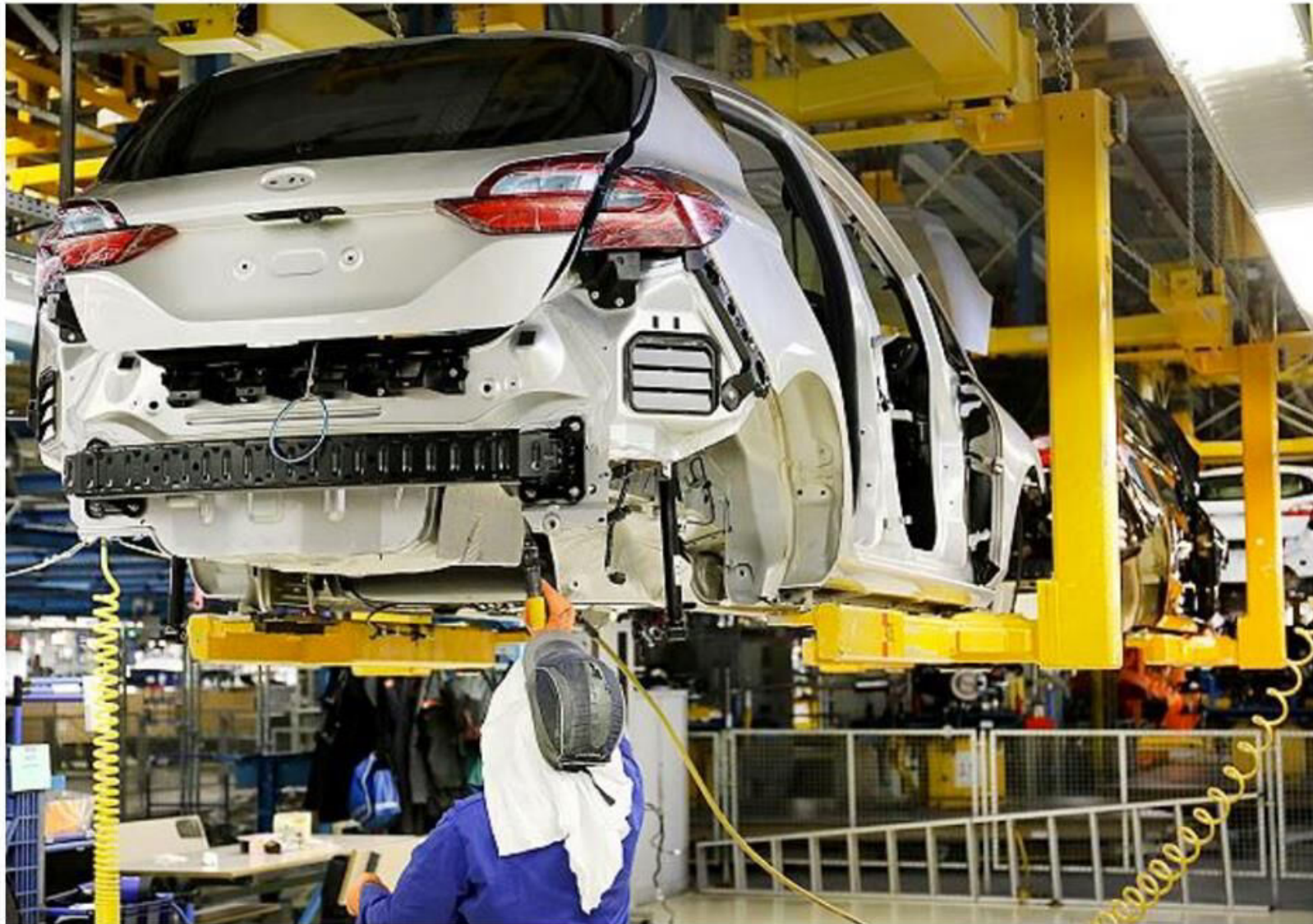
Ein Ford-Mitarbeiter arbeitet in der Produktion des Fiestas an einer Karosserie.