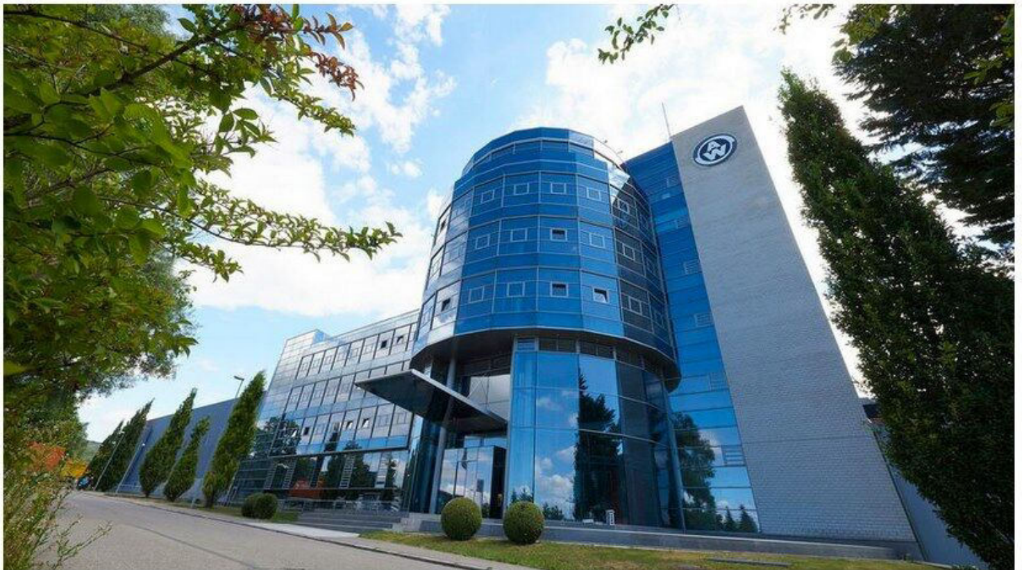
Zentrale von Weber in Markdorf

Der Autozulieferer meldet Insolvenz an.